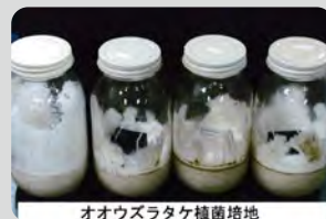
オオウズラタケ菌培養地

エコボロン®PRO は木材腐朽菌にも強力な効果があり、またカビ菌の繁殖も抑制します。 エコボロン®PRO は京都大学、東京農業大学、(財)建築研究協会などで防腐性能が確認されています。