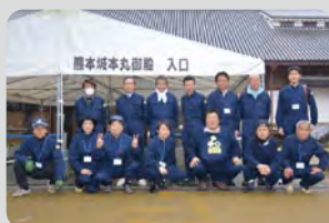
熊本城施工スタッフ

エコボロン®PRO は専門知識を持った認定施工士が、高品質な施工を実施いたします。木造住宅だけでなく、文化財にも採用実績。今までに無かった、安全で長持ちする木材保存処理として、注目されています。